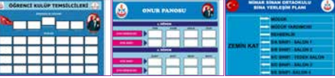
Tabela ve Panolarımız yenilendi.