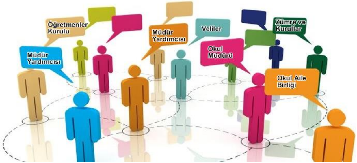
Şema 1. Paydaşlar

Belirlenen İç ve Dış Paydaşlara idarenin hangi ürün ve hizmetleriyle ilgili oldukları, idareden beklentileri, bu paydaşların idarenin ürün ve hizmetlerinin asıl etkilediği ve bunlardan nasıl etkilendiğinin belirlenmesi amacıyla "Paydaş Anketi" uygulanmıştır. Ankette Okulun eğitimi ve öğretimi, öğretmen ve okul memnuniyeti, idarenin tanınırlığı, idareye yönelik memnuniyet durumu, ilişkili olunan ve öncelik verilmesi gereken alanların tespit edilmesine yönelik sorulara yer verilmiştir.